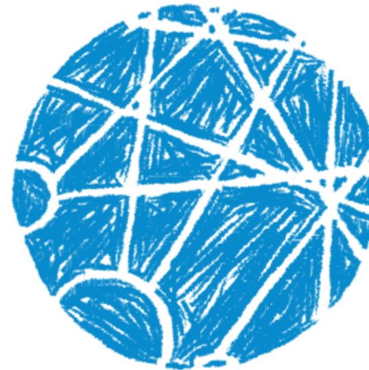
Dahlem School of Education

In der Schule wird unseren Absolvent*innen eine Vielzahl von ganz unterschiedlichen Situationen begegnen. Damit sie professionell reagieren können, sammeln sie in unserem Lehramtsstudium z.B. durch die Analyse von Unterrichtsvideos, die Simulation von Elterngesprächen oder mit Schüler*innengruppen Praxiserfahrungen. Indem sie diese Erfahrungen reflektieren, wachsen sie nach und nach in die Rolle einer Lehrer*in hinein.